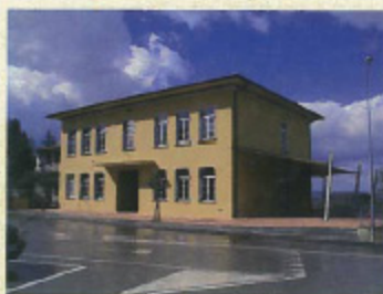
Il Centro Polivalente di Fabbrica