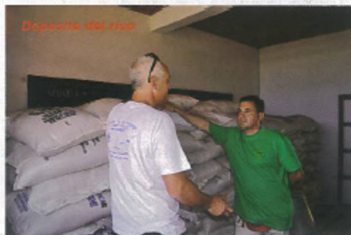
Deposito del riso