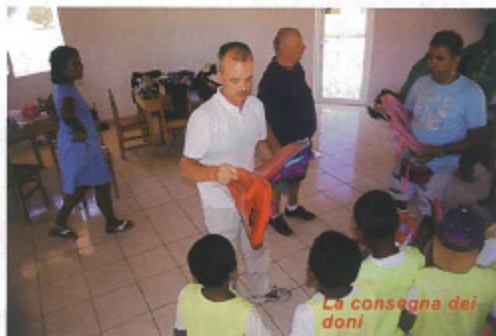
La consegna dei doni