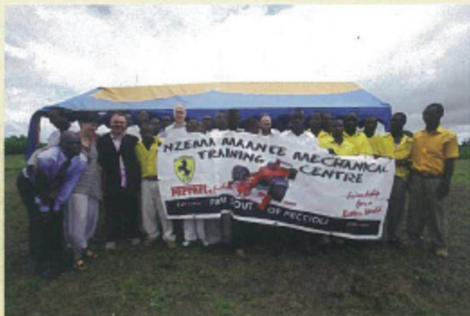
Nelle foto alcuni momenti della inaugurazione, con gli amministratori e le autorità del luogo.