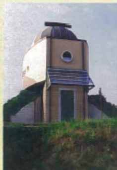
L'Osservatorio Astronomico di Libbiano