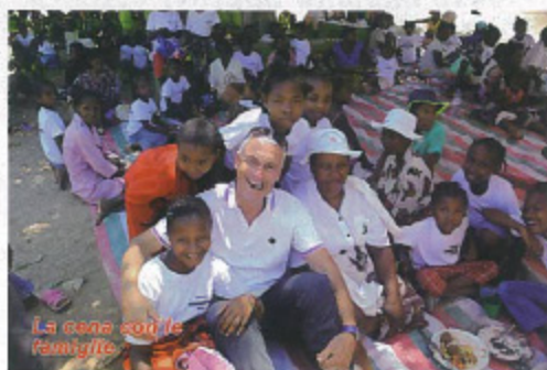
La cena con le famiglie